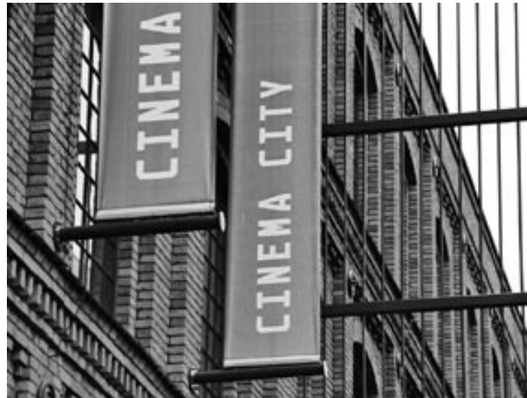
Cinema-City-Kino in Lodz. Die Kette betreibt ihre Lichtspielhäuser vorzugsweise in Einkaufszentren.

Cinema City errichtet außer Multiplexen Cinema Parks, in denen in