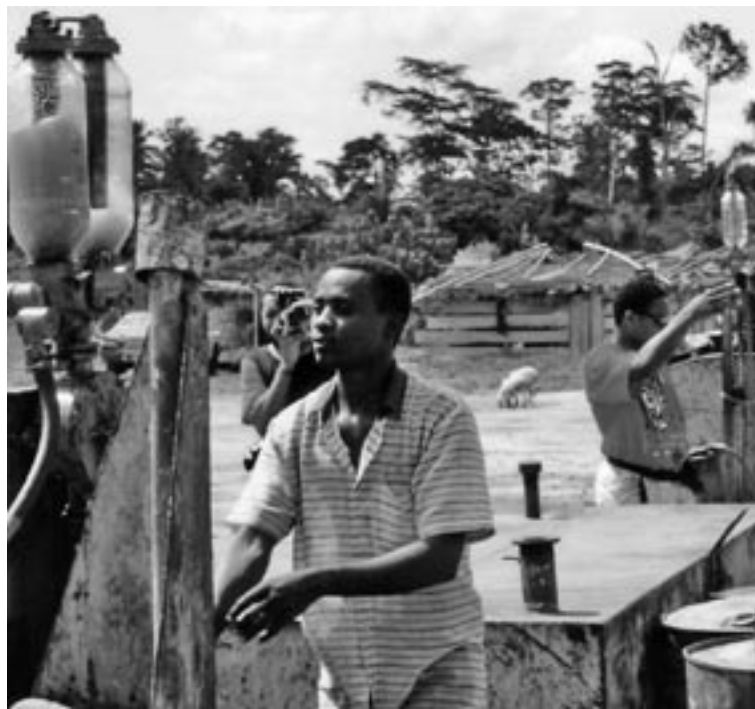
Arbeit an der Benzinpumpe: Erdöl stellt für Ghana eine wichtige Einnahmequelle dar.

Um europäischen Firmen den Markteintritt in Westafrika zu erleichtern, organisiert die GGEA die German-European Trade Fair (GEREU) in Accra. Die Veranstaltung im Herbst war nach Angaben der Organisatoren mit 940 registrierten Besuchern aus der Region sowie 40 Ausstellern aus Europa (Deutschland, Großbritannien, Dänemark, Österreich und Tschechien) sowie aus Tunesien, Nigeria, Sierra Leone und Liberia besonders erfolgreich. Bei der Organisation und Akquise für die Ausstellung arbeitet die GGEA unter anderem mit dem Afrika-Verein der deutschen Wirtschaft sowie dem European Business Council for Africa and the Mediterranean (EBCAM) zusammen.