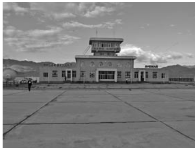
In den verschlafenen Flugplatz der Region Altai in Bijsk sollen 1,4 Mrd RUB investiert werden.

entstehen, 2010 weitere 8 km. Außerdem blieben die staatliche Finanzierung des Megaprojekts sowie die garantierten Steuererleichterungen