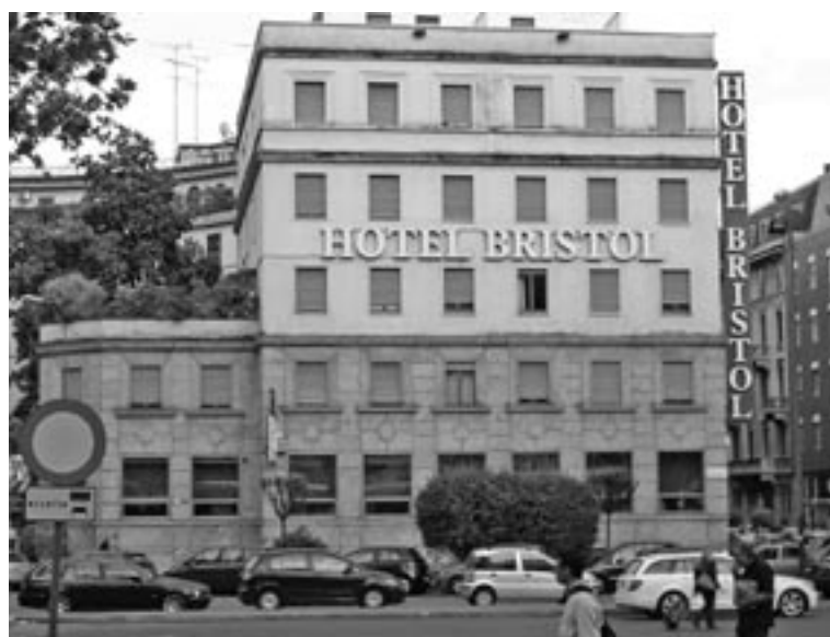
Hotel in Mailand: Das unansehnliche Äußere mancher Herbergen in Italien spiegelt sich im Preis oft nicht wider.

In den Jahren 1970 bis 1980 stand Italien mit 43% des weltweiten Fremdenverkehrsaufkommens noch