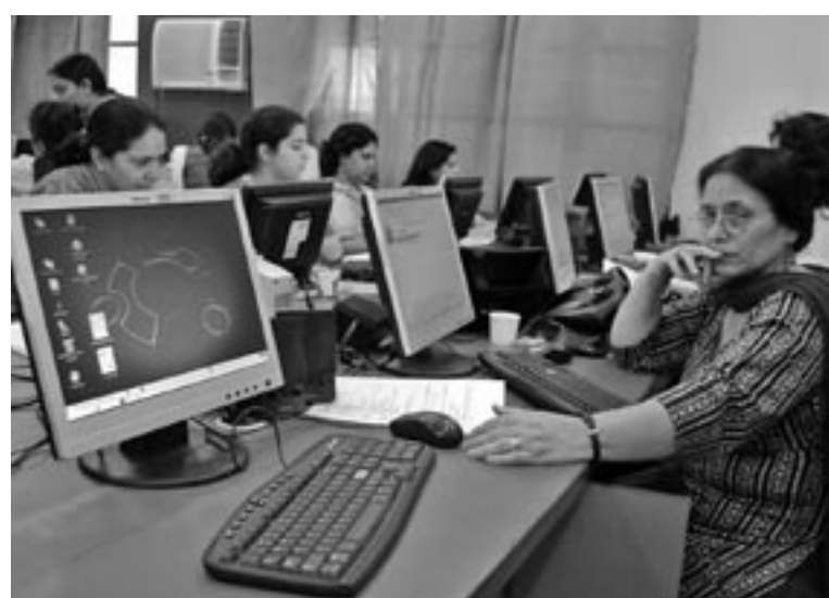
2010 wollen die Unternehmen und Privatleute in Indien wieder neuere PC-Modelle haben.

kommunikationsdienstleistern - um 46%. Der nach wie vor florierende Einzelhandel kaufte hingegen