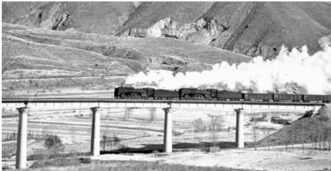
Allein für den Bau von Bahnstrecken hat die Zentralregierung 72,3 Mrd CNY bereit gestellt.

der Civil Aviation Administration of China (CAAC) dürften sich die Bruttoanlageinvestitionen 2009 auf 80 Mrd bis 100 Mrd CNY belaufen. Dies würde eine Steigerung von über 30% zum Vorjahr bedeuten. In den ersten acht Monaten legten die Investitionen im Vergleich zum Vorjahreszeitraum laut NBS um 24,6%