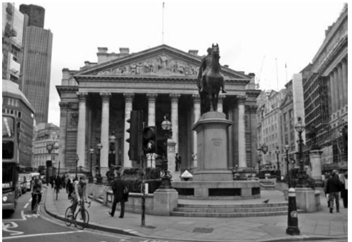
Börse am Finanzplatz London: In ihr Geschäft mit Finanzierungen und Wertpapieren aller Art wollen sich die Akteure nicht von Brüssel dreinreden lassen.

keiten zur Rettung einer Bank zwingen würde. Die schwedische EU-Ratspräsidentschaft will bis Jahresende eine politische Einigung der Mitgliedstaaten über die Regulierung erreichen und hat dafür weitgehende Zugeständnisse an Großbritannien gemacht. Die Briten wollen aus Sorge um den Finanzplatz London, Europas größtem Hedgefonds-Standort, die Vorschriften verwässern. Deutschland und Frankreich sind dagegen für eine harte Gangart. Parlament und Mitgliedstaaten wollen die Richtlinie mit nur einer